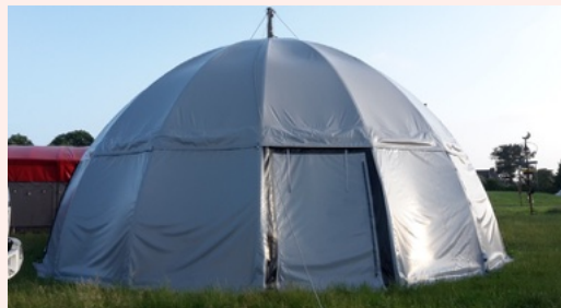
Photo de face avec une des sorties de secours